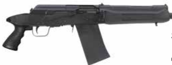
Saiga 12 Pistol

Calibro: 12/76 Peso a vuoto: 3,6 Kg Lunghezza: 600 mm Capacità caricatore: 8 Colpi Lunghezza canna: 270 mm