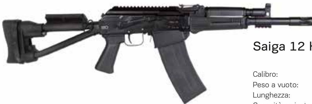
Saiga 12 KKC-C

SAIGA 12 KC Versione tattica a standard militare con pistol grip del Saiga-12, canna filettata e flash hider. Dispone di slitta laterale ad attacco rapido e caricatore a baionetta.